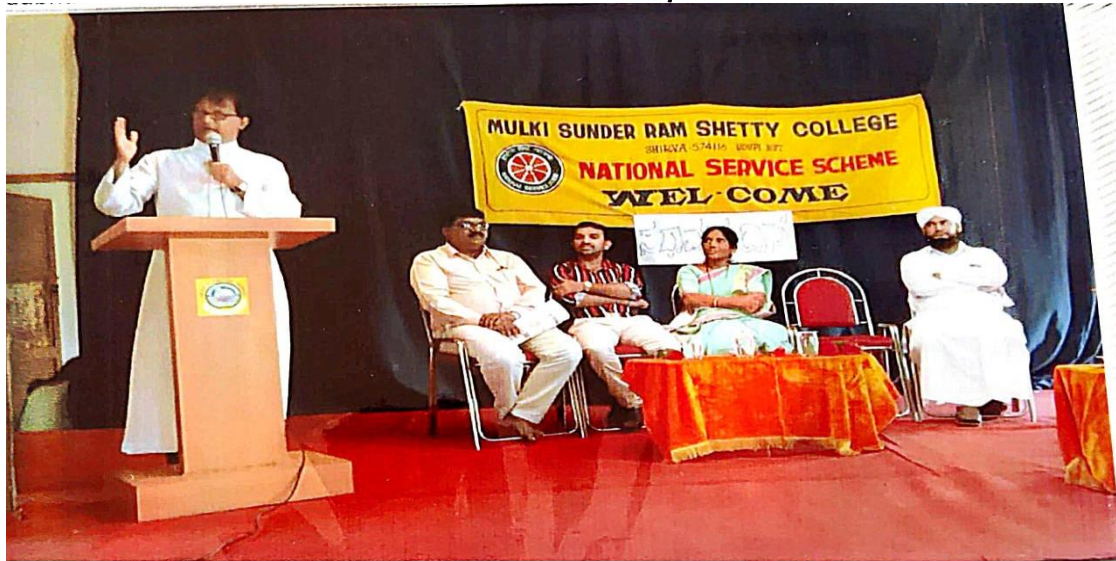
Chief Guest delivering the speech.